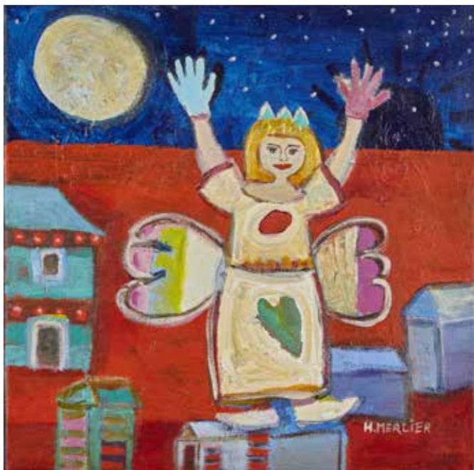
Viens jouer d'Hélène Mercier Acrylique sur toile, 2006, 30 cm X 30 cm